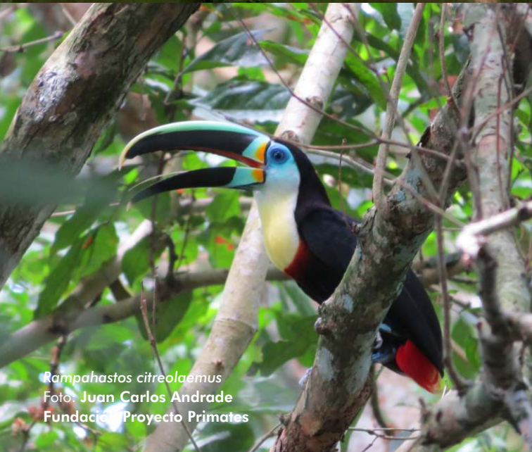
Ramphastos citreolaemus