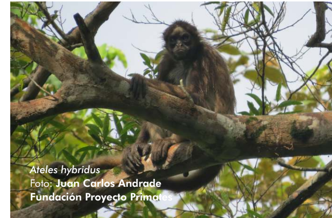
Ateles hybridus

Haciendas de Antioquia y Santander se unen al trabajo en beneficio de la biodiversidad.