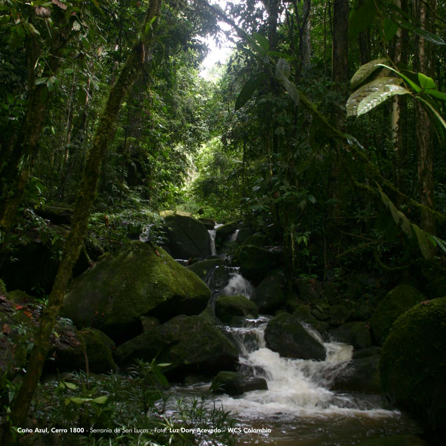
Caño Azul, Cerro 1800 - Serranía de San Lucas