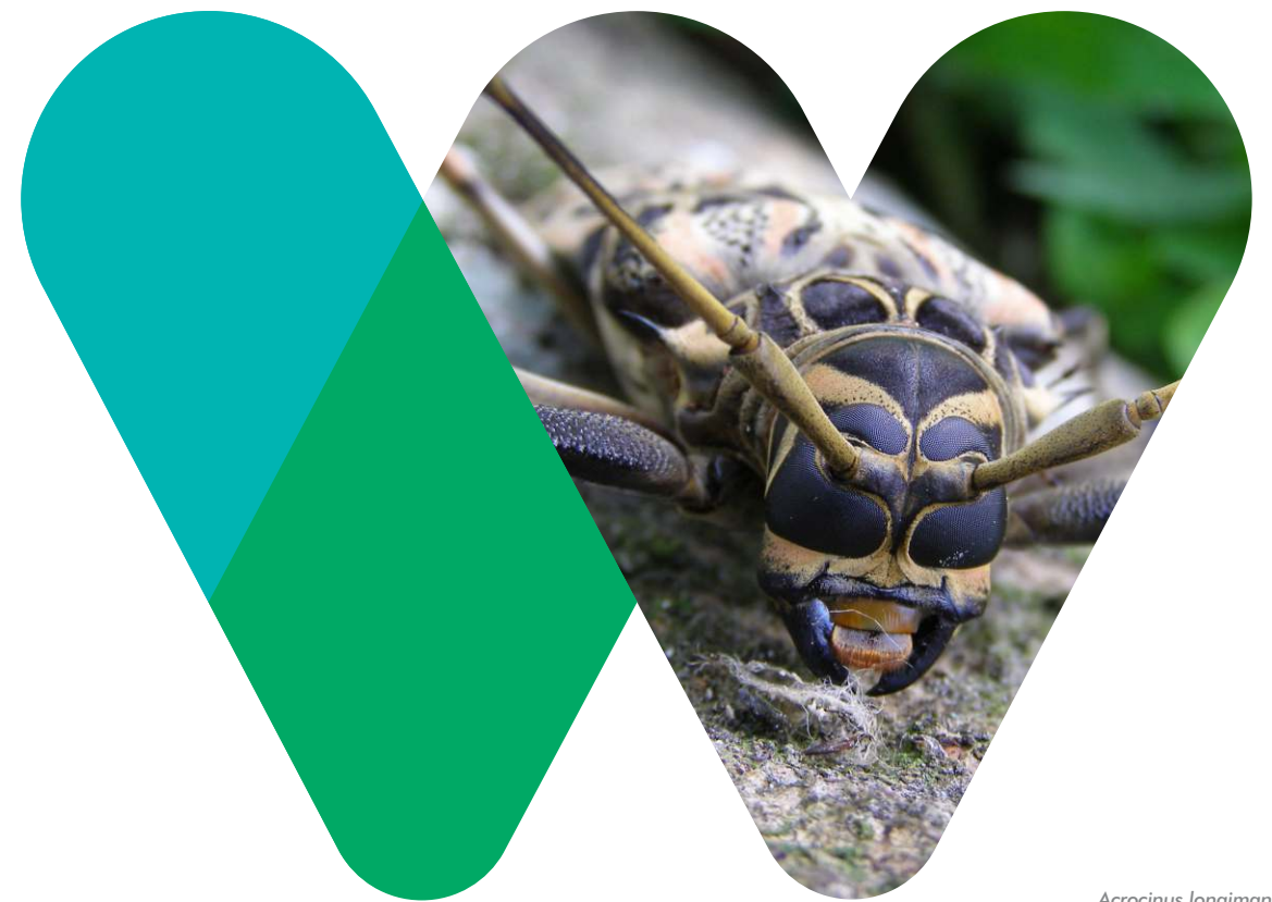
Acrocinus longimanus

Boletín divulgativo de WCS Colombia - Enero de 2017 - No. 12