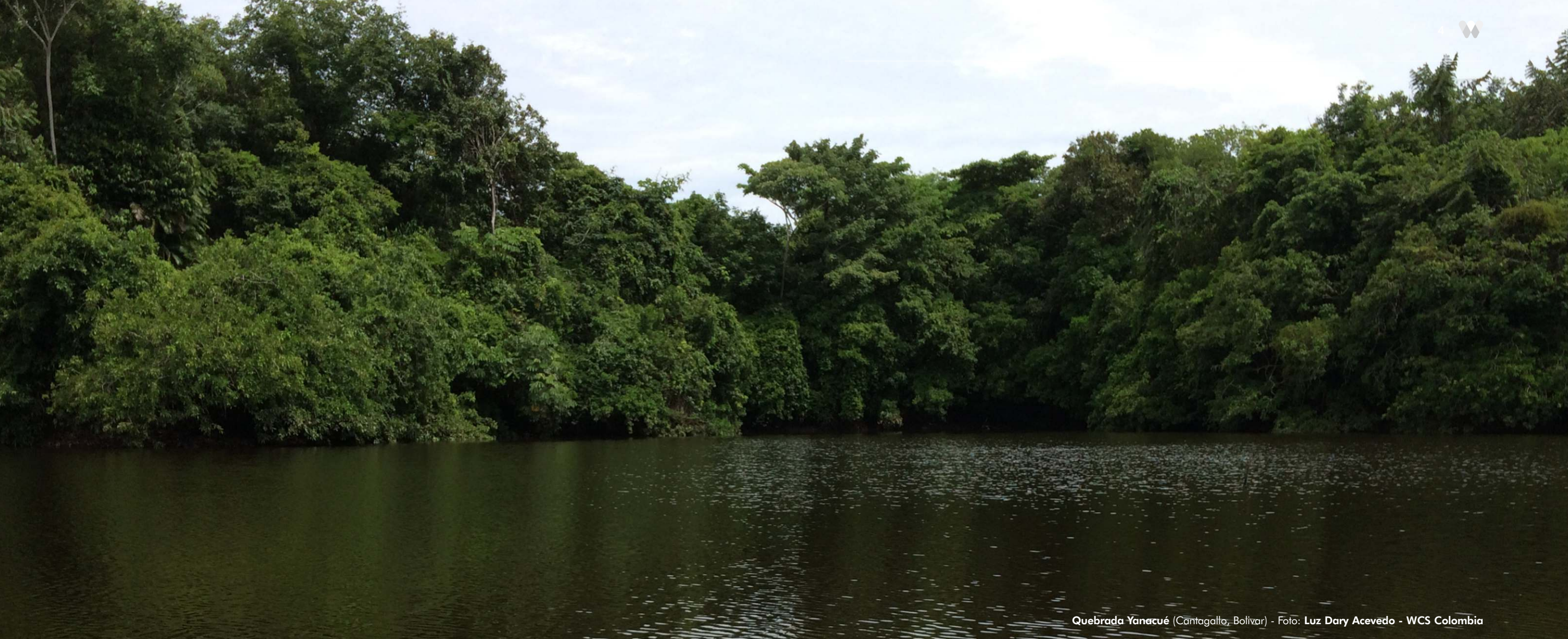
Quebrada Yanacué (Cantagallo, Bolívar)