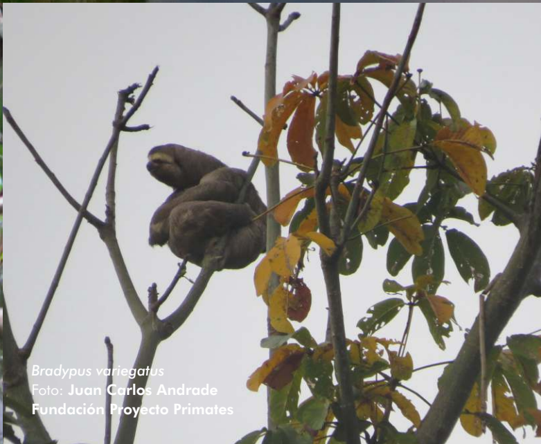
Bradypus variegatus